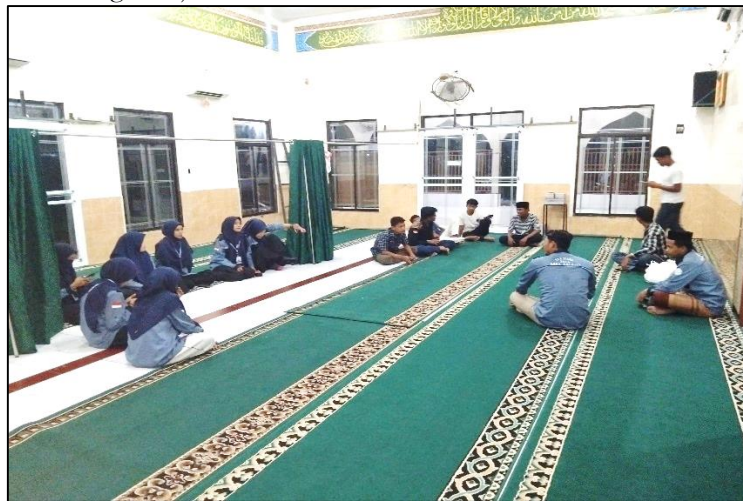
Gambar 2. Dokumentasi Sesi Tanya Jawab

Antusiasme peserta pelatihan sangat terlihat saat dibuka sesi Tanya jawab seputar masalah penyelenggaraan jenazah. Narasumber menjawab semua pertanyaan yang diajukan dibarengi dengan solusi yang dapat dilaksanakan untuk memecahkan masalah yang timbul. Penyampaian materi dilakukan dengan menggunakan bahasa yang sederhana dan mudah difahami oleh peserta, sehingga pelatihan dan diskusi berjalan lancar dan sesuai dengan tujuan.