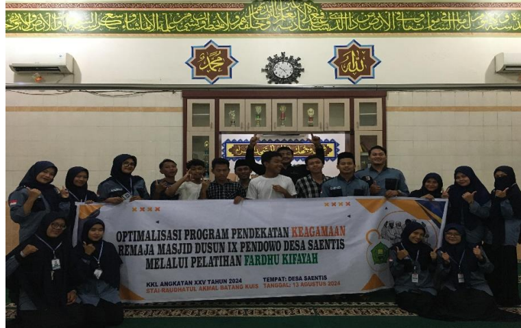
Gambar 3. Dokumentasi Setelah Selesai Pelaksanaan Pelatihan Fardhu Kifayah