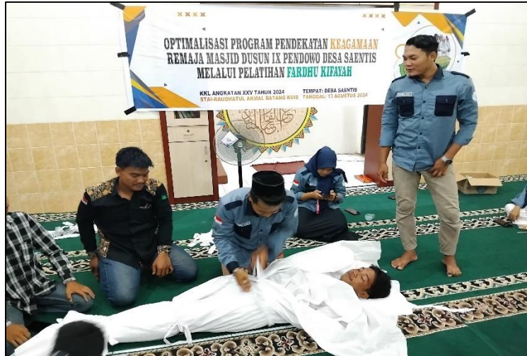
Gambar 1. Pelaksanaan Kegiatan Mengkafani

Antusiasme peserta pelatihan sangat terlihat saat dibuka sesi Tanya jawab seputar masalah penyelenggaraan jenazah. Narasumber menjawab semua pertanyaan yang diajukan dibarengi dengan solusi yang dapat dilaksanakan untuk memecahkan masalah yang timbul. Penyampaian materi dilakukan dengan menggunakan bahasa yang sederhana dan mudah difahami oleh peserta, sehingga pelatihan dan diskusi berjalan lancar dan sesuai dengan tujuan.